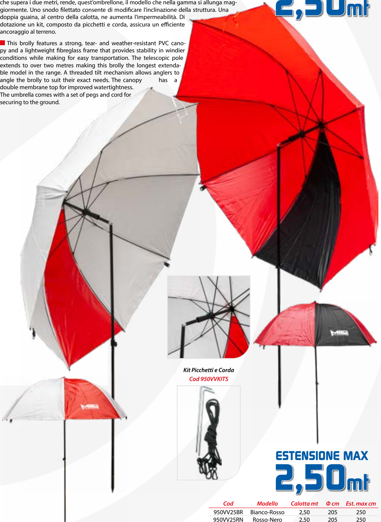
Kit Picchetti e Corda Cod 950VVKITS